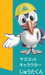
マスコット キャラクター じゅうたくん